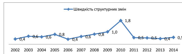
Рис. 3. Швидкість галузевих структурних змін економіки України

Наскільки вітчизняна економіка пристосовується до змін на внутрішньому та зовнішніх ринках, ми можемо судити з аналізу швидкості структурних змін (рис. 3).