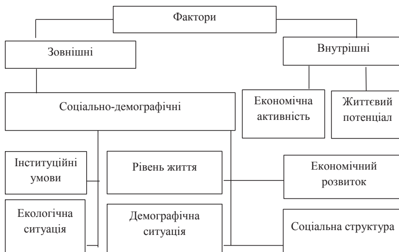
Рис. 1. Фактори впливу на туристичну індустрію

7. Культурно-історичні чинники відображають багатство матеріальної і духовної культури народів і включають: старовинні міста, пам'ятки архітектури; місцевості, пов'язані зі знаменними