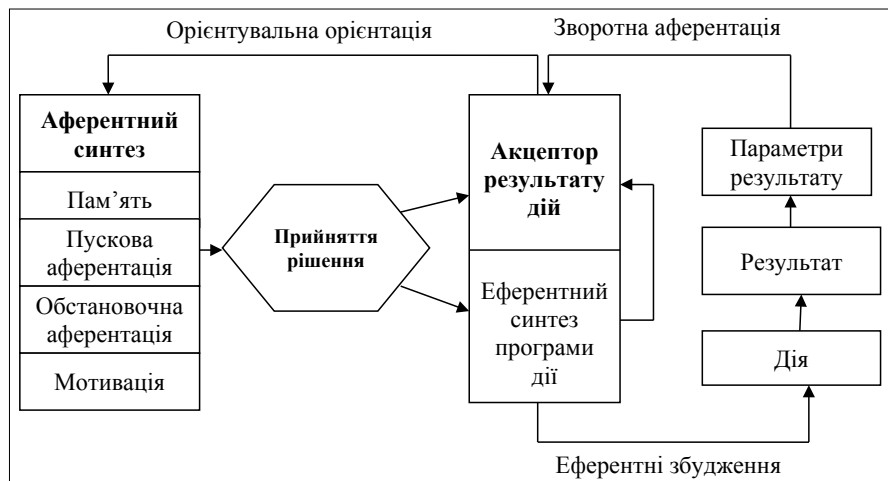
Рис. 1. Функціональна система управління П.К. Анохіна [9]

Щодо управління системою економічної безпеки роздрібно-го підприємства торгівлі як функціональною системою, то на відміну від класичної процедури управління системою існує й інший підхід, який, на нашу думку, доцільно застосовувати під час управління економічною безпекою торговельного підприємства. Цей підхід запропоновано П.К. Анохіним як схема поведінкового акту у функціональній системі для досягнення пристосувального ефекту системи, що вважають аналогом процесу управління (рис. 1).