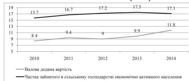
Рис. 1. Показники ролі сільського господарства в економіці України в 2010–2014 рр., % до загального підсумку [6, с. 30, 35]

Як показник ролі сільського господарства в економіці застосовують частку зайнятого в сільському господарстві економічно активного населення (рис. 1), а також питому вагу сільського господарства в структурі ВВП. Ці показники достатньо високі в більшості країн, що розвиваються, де в сільському господарстві зайнято більше половини економічно активного населення (ЕАН).