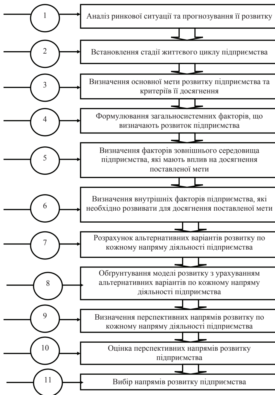
Рис. 1. Напрями здійснення стратегічного планування на підприємстві [5]

Під час формування стратегій слід указати на динамічний підхід, в якому перевага надається оцінці та реагуванню на зміни у зовнішньому середовищі, яке розглядається як багатогранна категорія, що включає цінності споживача, цінності акціонерів та персоналу, можливість реагування підприємства на зовнішні та внутрішні проблеми. Перевагою цього підходу є можливість постійного реагування на зміни, що від-