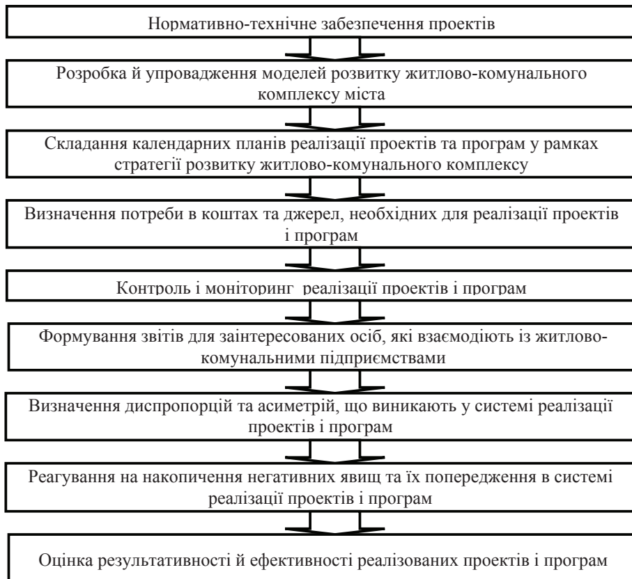
Рис. 3. Заходи щодо розробки й упровадження системи управління стратегією розвитку підприємств житлово-комунального господарства [8]