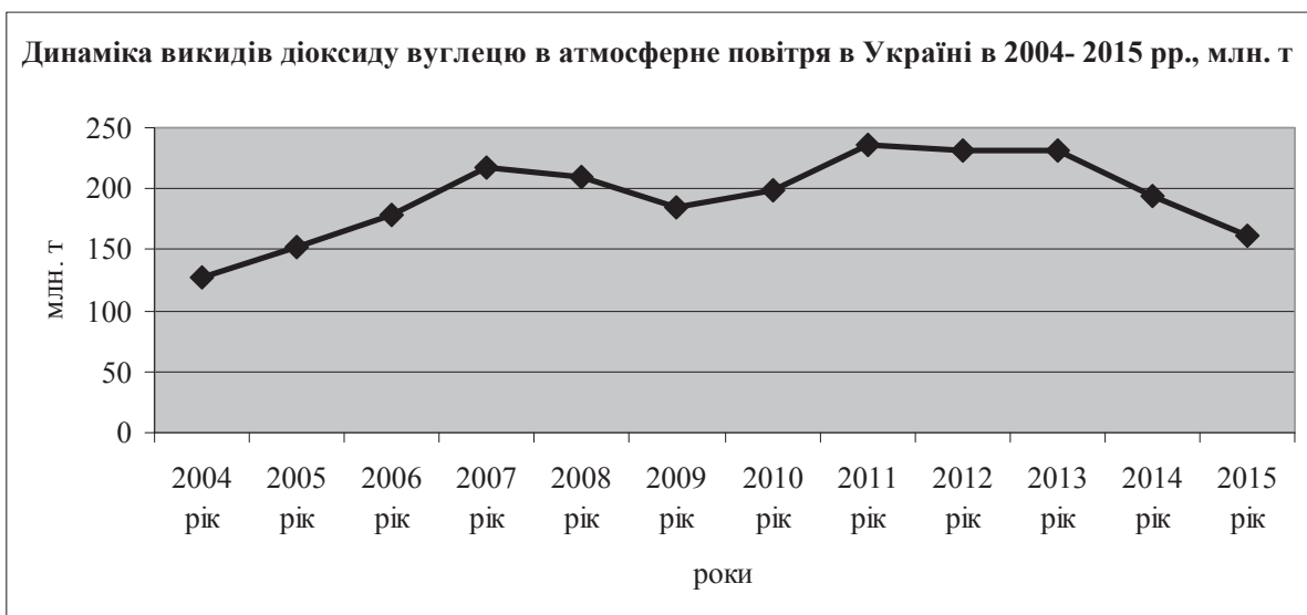
Рис. 1. Витрати на охорону та використання природних ресурсів України за напрямками в 2015 р., тис. грн. [1]

По-третє, підписання в березні 2015 р. Угоди між Україною і Європейським Союзом про участь України у Рамковій програмі ЄС із наукових досліджень та інновацій «Горизонт 2020». Участь України у цій програмі передбачає доступ до всього