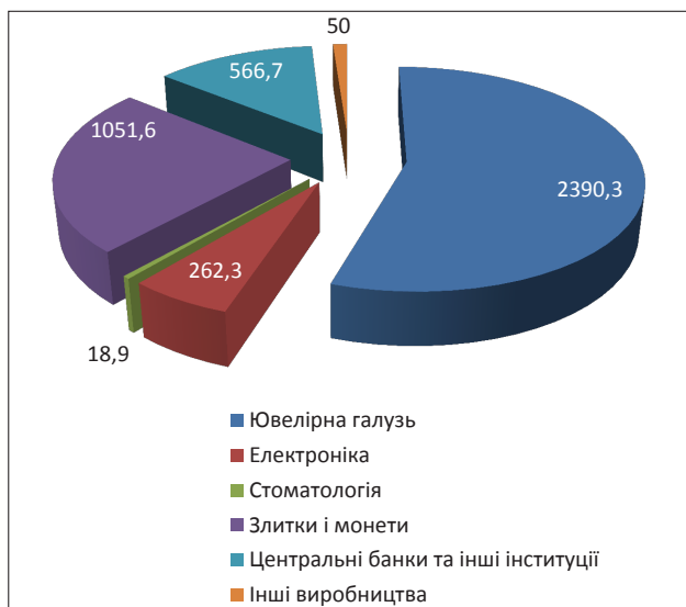
Рис. 1. Світовий попит на золото в тон. у 2015 році

Виробничий попит на золото, коли воно виступає сировинним компонентом, в середньому складає 10% від загального попиту, йдеться про такі галузі як електроніка, медицина, виробництво електричних деталей. На теперішньому етапі сфери застосування золота розширюються завдяки його використанню у виробництві паливних елементів, при хімічній обробці та здійсненні контролю за забрудненням оточуючого середовища, оскільки метал характеризується тепловою та електричною провідністю, спротивом бактеріологічній колонізації і корозії [4].