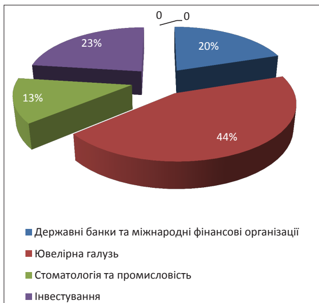
Рис. 3. Світовий розподіл золота у 2015 році, %