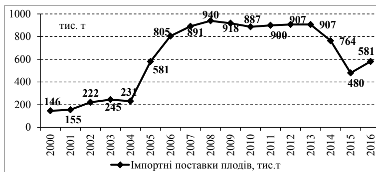
Рис. 2. Динаміка імпортованих поставок плодів на вітчизняний ринок, тис. т

Джерело: розраховано автором за статистичними даними [http://www.ukrstat.gov.ua/]