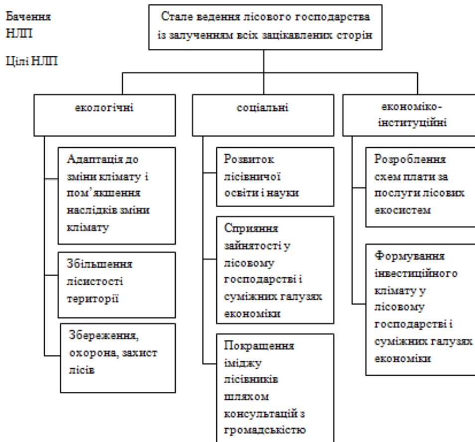
Рис. 2. Бачення та цілі національної лісової політики України