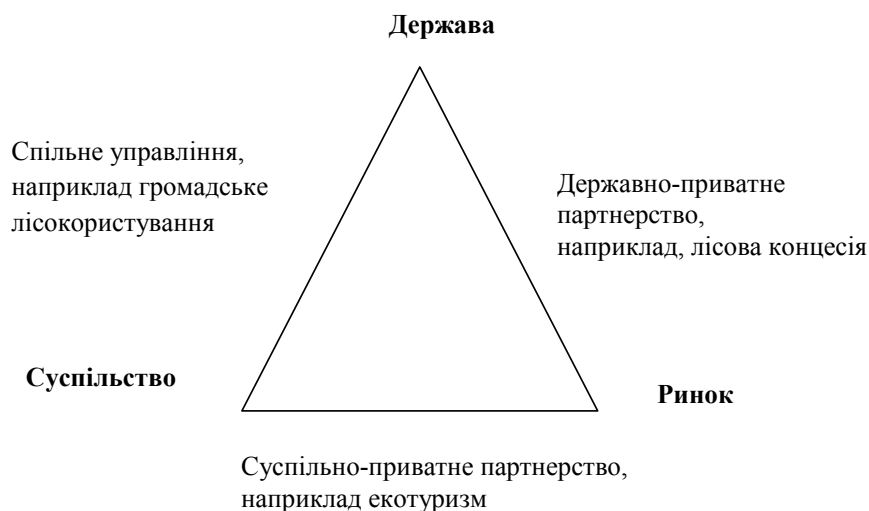
Рис. 3. Підходи до управління лісовим господарством у контексті взаємодії зацікавлених сторін [20]