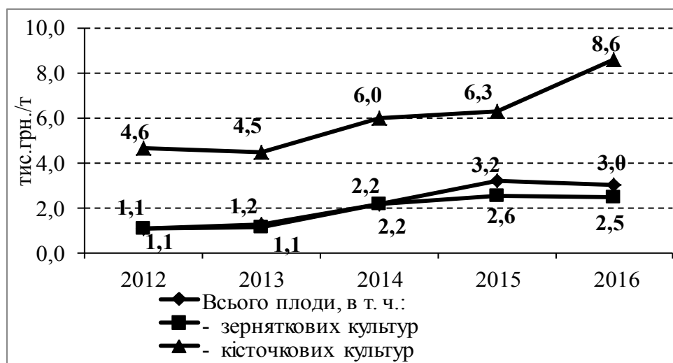
Рис. 3. Закупівельні ціни сільськогосподарських підприємств на плодіву сировину, тис. грн./т