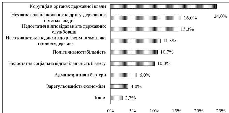
Рис. 2. Причини неефективного державного регулювання економіки в Україні

Сильний та надмірний контроль є значною проблемою для ведення бізнесу. Зниження впливу цього чинника можливе лише шляхом безпосереднього скорочення повноважень державних органів щодо контролю та посилення прозорості цих дій.