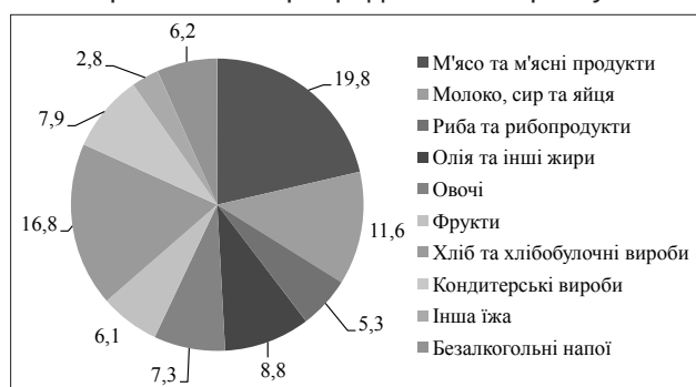
Рис. 2. Витрати домогосподарств на продукти харчування та напої за один місяць, 2016 рік, дол. США [28]

вані магазини (як фізичні, так і онлайн), на які припадає найбільший асортимент як вітчизняної, так і імпортованої органічної продукції. Органічні товари можна придбати в таких гіпермаркетах/супермаркетах, як «Фоззі», «Ашан», «Мегамаркет», «Сільпо», «ГудВайн», «Метро», «Новус», «Білла», «Велика Кишеня»; онлайн-платформи / фізичні: «Натур Бутік», Biologic. ua, «Еко Чік» (Eco Chic), «Комора», «Вегетус», «Еко клуб», «Органік Ера». Збільшення частини світової онлайн-торгівлі має вплив і на розвиток української онлайн-торгівлі. За останніми даними [29], майже 3 млн. українців є онлайн-споживачами, однак ця тенденція розповсюджена тільки на сегмент одягу та техніки. Створення торговельних онлайн-платформ є стратегічним напрямом розширення внутрішнього органічного агропродовольчого ринку.