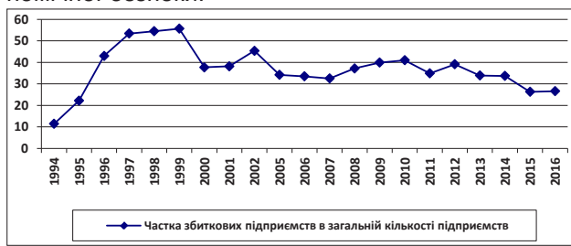
Рис. 2. Частка кількості збиткових підприємств в загальній кількості підприємств за період 1997-2017 рр. [складено за 5; 6; 7; 8]

ринку, але й про неможливість забезпечення економічної безпеки.