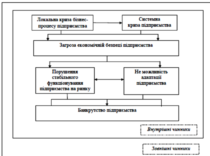
Рис. 3. Процес настання банкрутства підприємства

Банкрутство є кінцевим результатом діяльності підприємства. Проте воно настає не одразу (рис. 3).