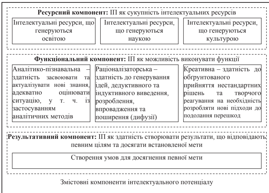
Рис. 2. Змістовні компоненти інтелектуального потенціалу згідно з комплексним підходом

Як бачимо з рис. 2, ресурсний компонент передбачає розгляд інтелектуального потенціалу як сукупності інтелектуальних ресурсів, що генеруються освітою, наукою, культурою. Саме ці три сфери здатні генерувати інтелектуальні ресурси, які в подальшому можуть сформувані інтелектуальний потенціал.