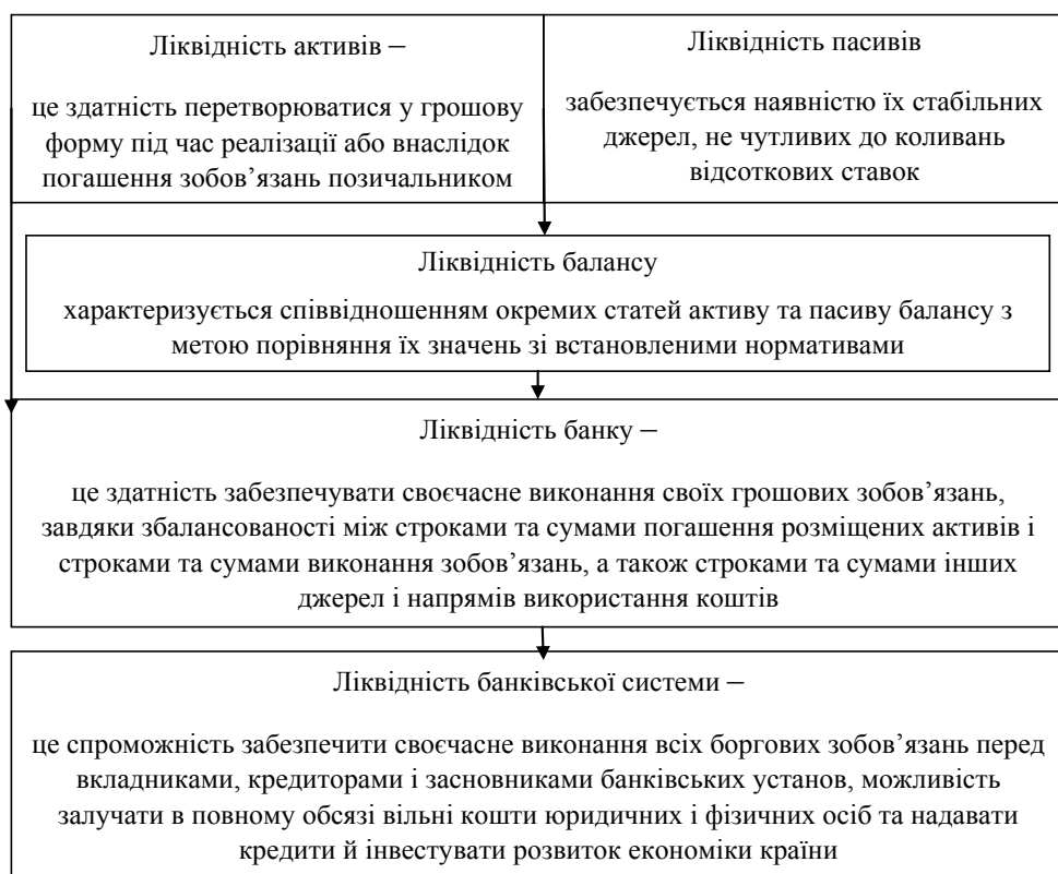
Рис. 1. Взаємозв'язок понять «ліквідність банківської системи», «ліквідність банку», «ліквідність балансу», «ліквідність активів та пасивів»

на основі всебічного аналізу всіх факторів, які тією чи іншою мірою впливають на можливість банку виконувати свої зобов'язання та задовольняти попит на кредити.