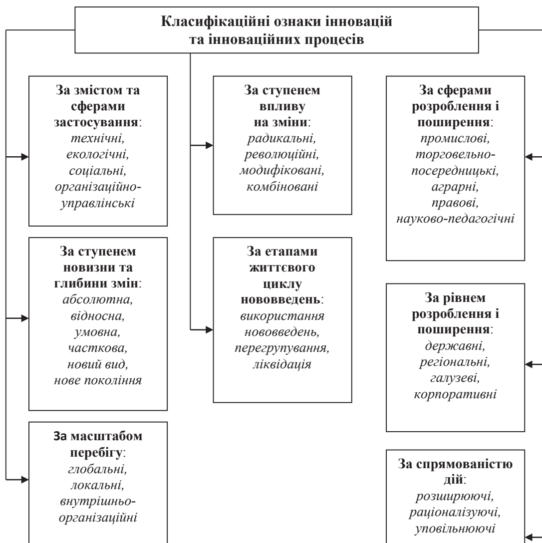
Рис. 1. Класифікація інновацій та пов'язаних із ними інноваційних процесів [3, с. 26]

В енциклопедичній літературі інновація подається як «новий підхід до конструювання, виробництва, збуту товарів, завдяки чому інноватор та його компанія здобувають переваги над конкурентами» [7, с. 656]. Водночас за міжнародними стандартами досліджувана категорія має ширше обґрунтування, оскільки її визначають як кінцевий результат інноваційної діяльності, відображений у вигляді нових чи вдосконалених продуктів, упроваджених на ринку, нового чи вдосконаленого технологічного процесу, що використовується у практичній діяльності, або нового підходу до соціальних послуг [10, с. 9].