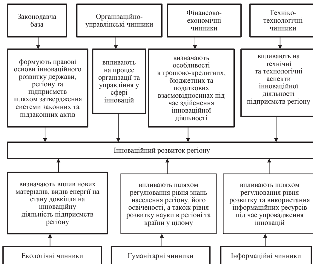
Рис. 3. Чинники впливу на інноваційний розвиток регіону [6, с. 16]