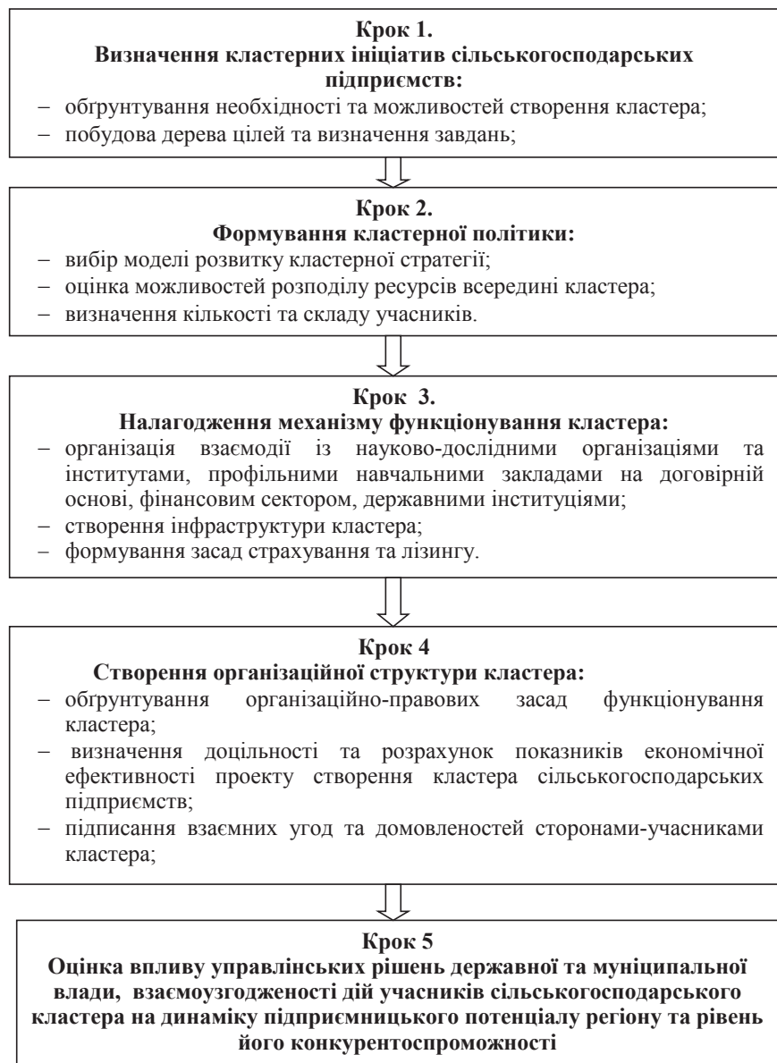
Рис. 4. Кроки та заходи щодо створення кластера малих і середніх сільськогосподарських формувань [розроблено автором]

– на рівні господарюючих суб'єктів необхідне виявлення ініціативи об'єднання у кластер, ініці-