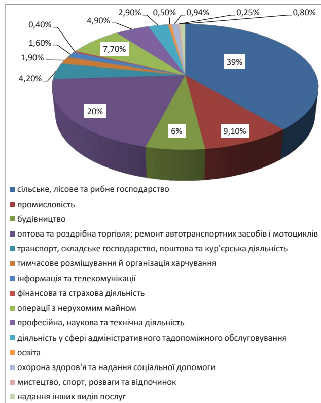
Рис. 3. Малі підприємства Миколаївської області за видами економічної діяльності у 2016 році, % (розраховано автором за [17])

У 2017 році загальна кількість зайнятих у сфері малого підприємництва області, яка складалася із кількості найманих працівників на малих підприємствах та фізичних осіб – підприємців, становила понад 120,4 тис. осіб (21,2% працездатного населення області) [16].