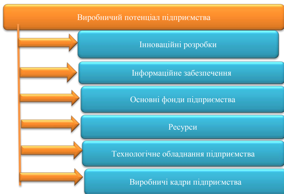
Рис. 3. Складники виробничого потенціалу

планування, тому від того, наскільки ефективно буде сформований виробничий потенціал, залежить працездатність внутрішнього господарського механізму, який здатний забезпечити ефективне функціонування промислового підприємства [5].