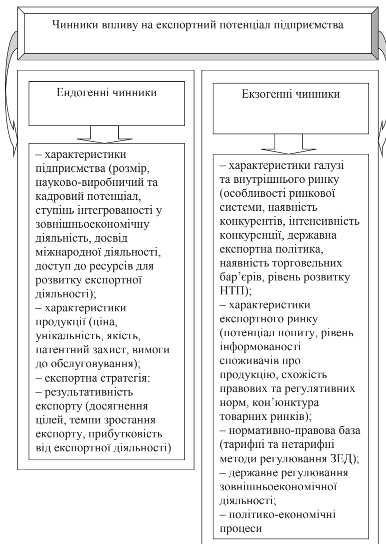
Рис. 2. Чинники впливу на експортний потенціал підприємства