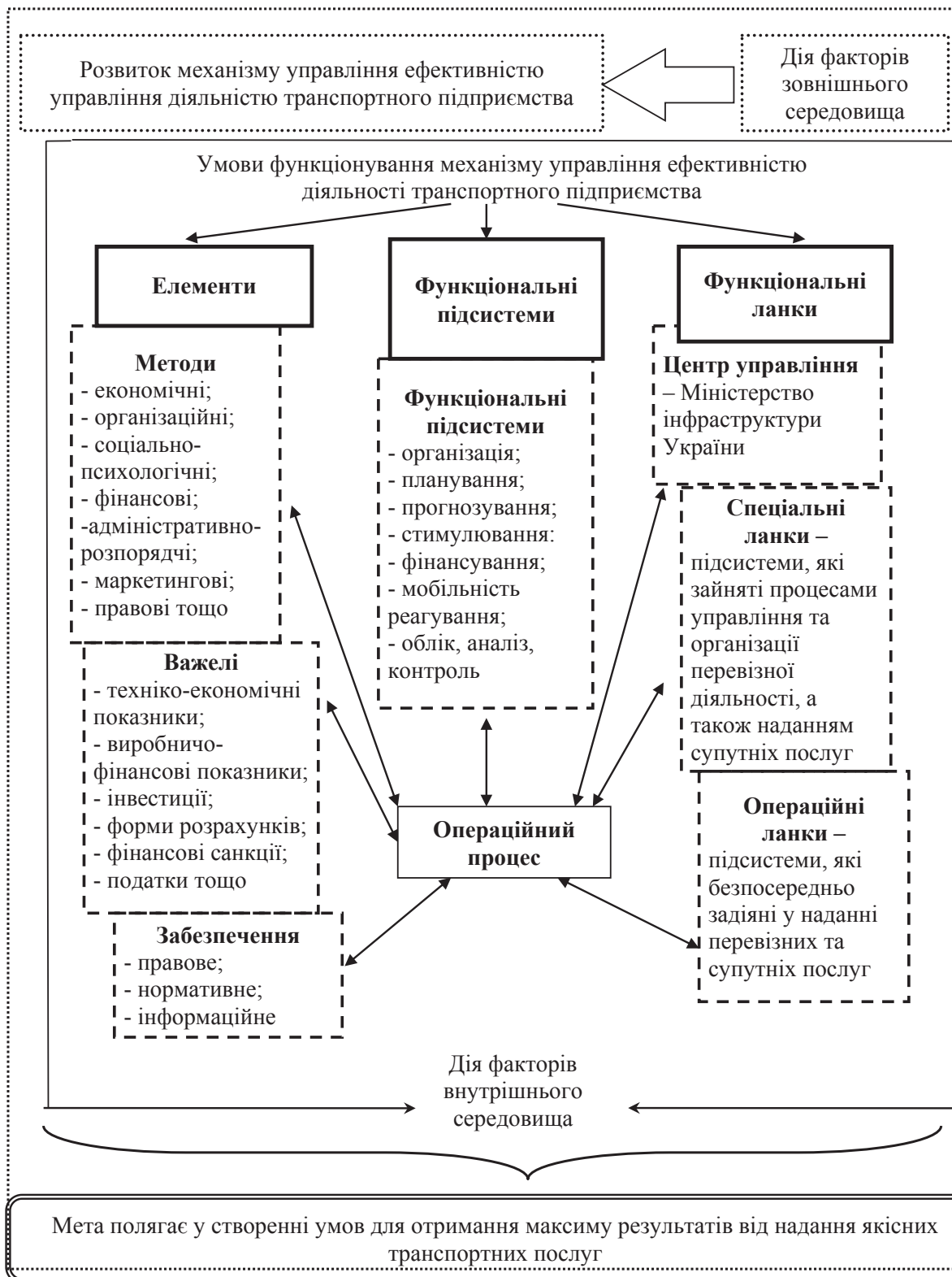
Рис. 3. Схема управління механізмом управління ефективністю діяльності транспортного підприємства

Слід зазначити, що зміни розвитку складових механізму управління ефективністю транспортного підприємства залежать від їх збалансованості,