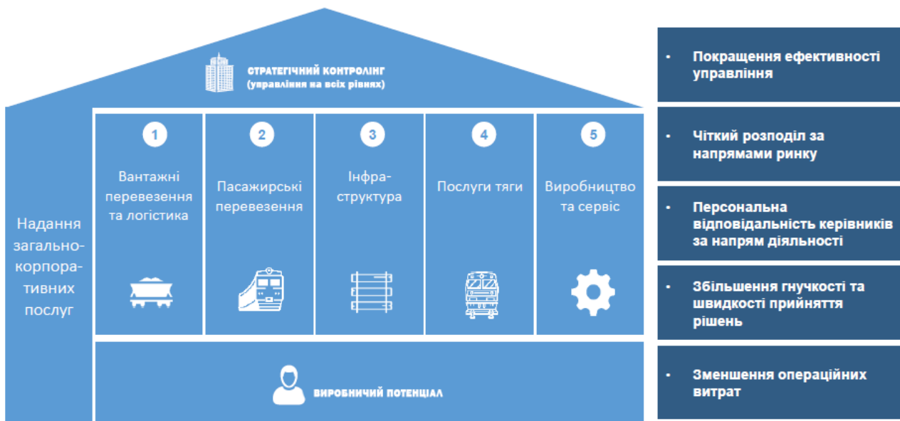
Рис. 2. Цільова бізнес-модель АТ «Українська залізниця»