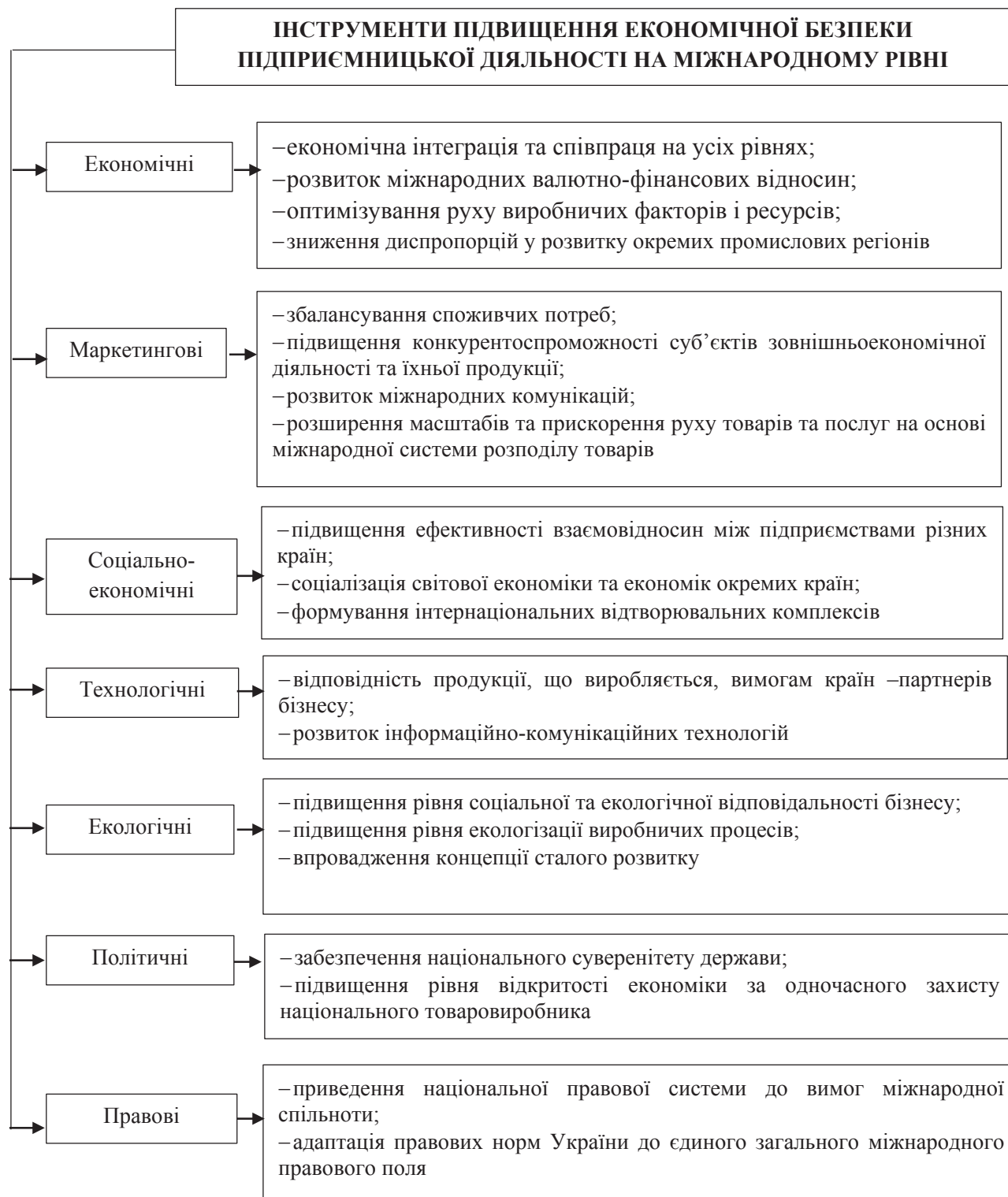
Рис. 2. Класифікація інструментів підвищення економічної безпеки підприємницької діяльності

Дослідивши передовий світовий досвід розвинутих країн світу у сфері організації економічної безпеки підприємницької діяльності, можна ствер-