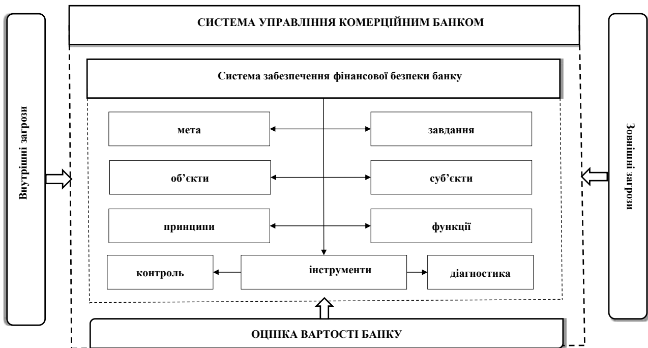
Рис. 3. Система забезпечення фінансової безпеки комерційного банку за вартісно-орієнтованим підходом