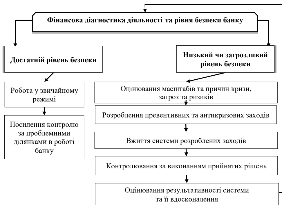
Рис. 4. Алгоритм функціонування системи забезпечення фінансової безпеки комерційного банку