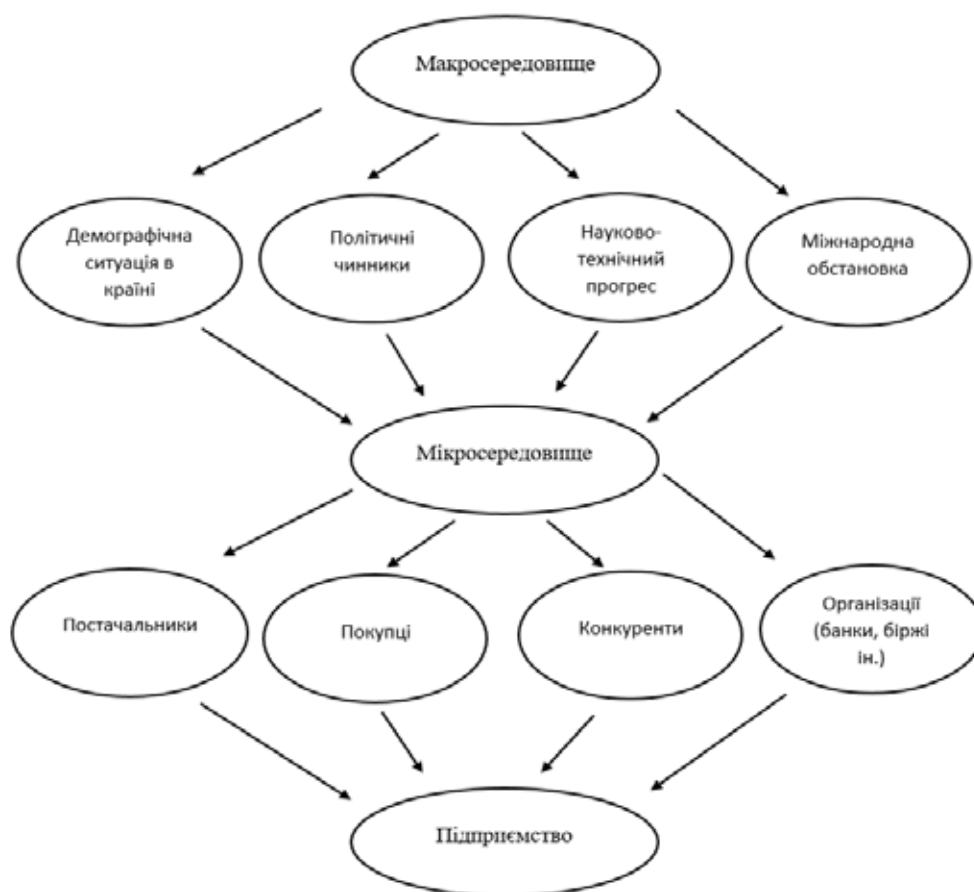
Рис. 1. Структура впливу макро- та мікросередовищ на підприємство