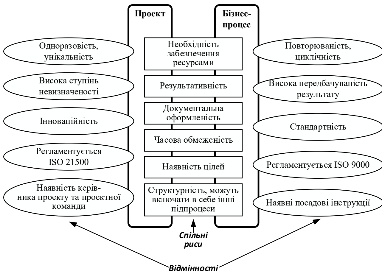
Рис. 2. Спільні та відмітні характеристики проекту та бізнес-процесу