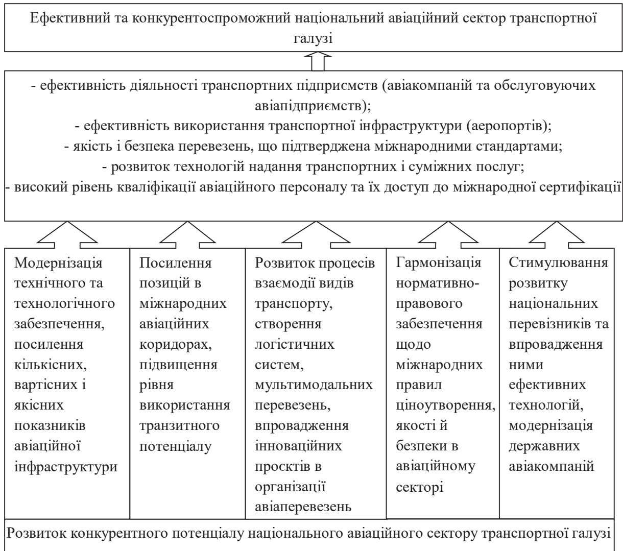
Рис. 2. Напрями розвитку конкурентного потенціалу авіаційного сектору транспортної галузі України