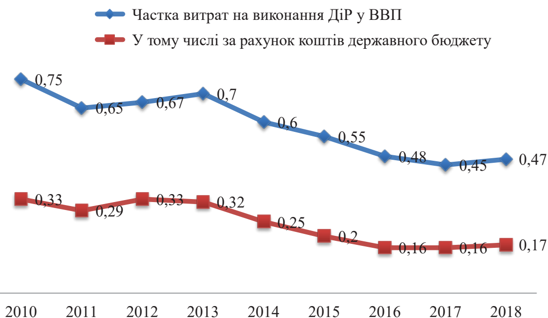
Рис. 2. Динаміка наукоємності ВВП України, %