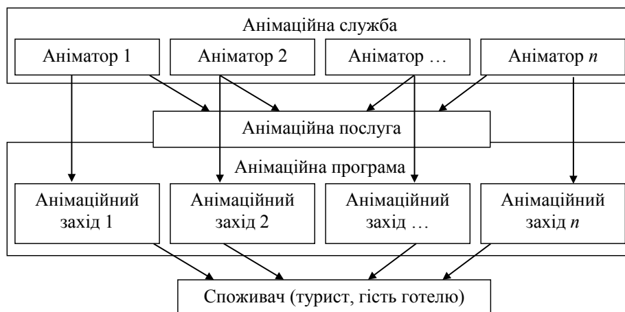
Рис. 1. Механізм реалізації анімаційних послуг

Ефективна організація роботи анімаційної служби готелю/туркомплексу покликана забезпечити оптимальну взаємодію всієї анімаційної команди та всіх її структурних елементів. Організація анімаційної діяльності як складова частина технологічного процесу вимагає жорсткого дотримання професійної самостійності всіх фахівців та одночасно всебічного розвитку їх активності й іні-