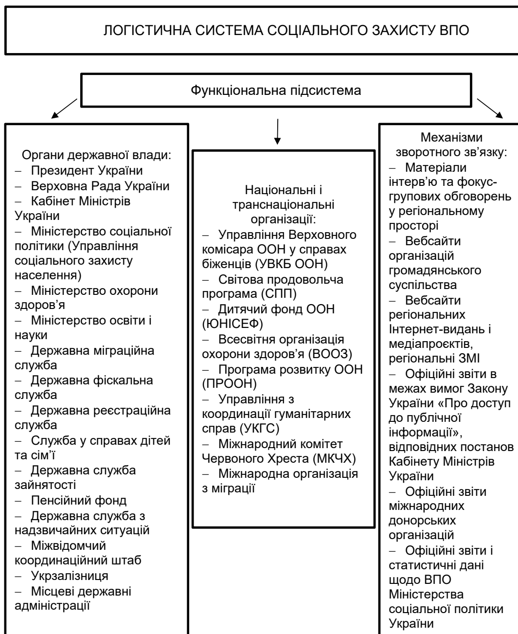
Рис. 1. Структурні елементи соціального захисту ВПО