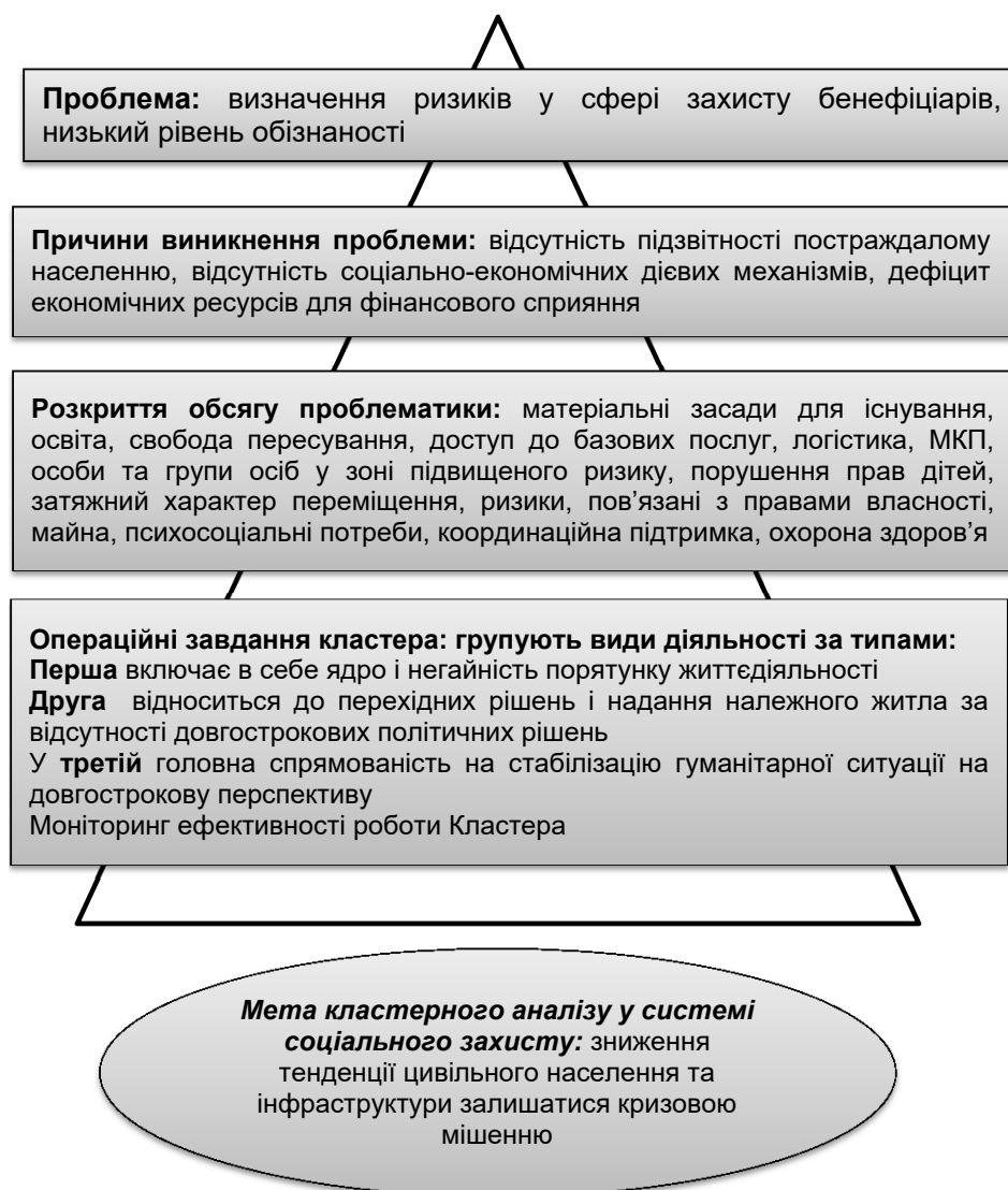
Рис. 3. Кластерний аналіз економічного забезпечення соціального захисту ВПО