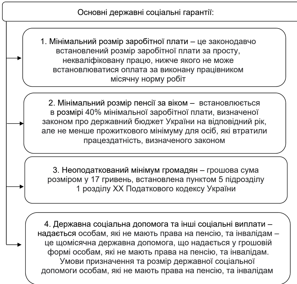
Рис. 1. Основні державні соціальні гарантії в Україні