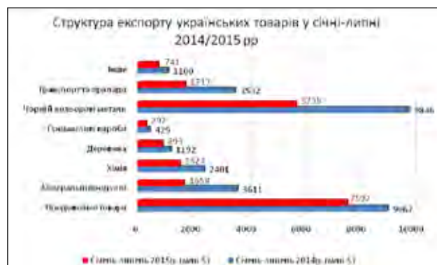
Рис. 1. Структура експорту українських товарів у січні-липні 2014–2015 рр.

Загалом, структура експорту українських товарів у січні-липні 2014–2015 рр. наглядно представлена на рисунку 1.