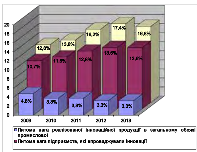
Рис. 1. Динаміка інноваційної активності промислових підприємств в Україні, 2009–2013 років, % [3]

Динаміку інноваційної активності підприємств в Україні протягом 2009–2013 років представлено на рис. 1.