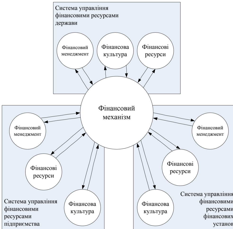
Рис. 3. Фінансовий механізм як інтегруючий елемент систем управління фінансовими ресурсами