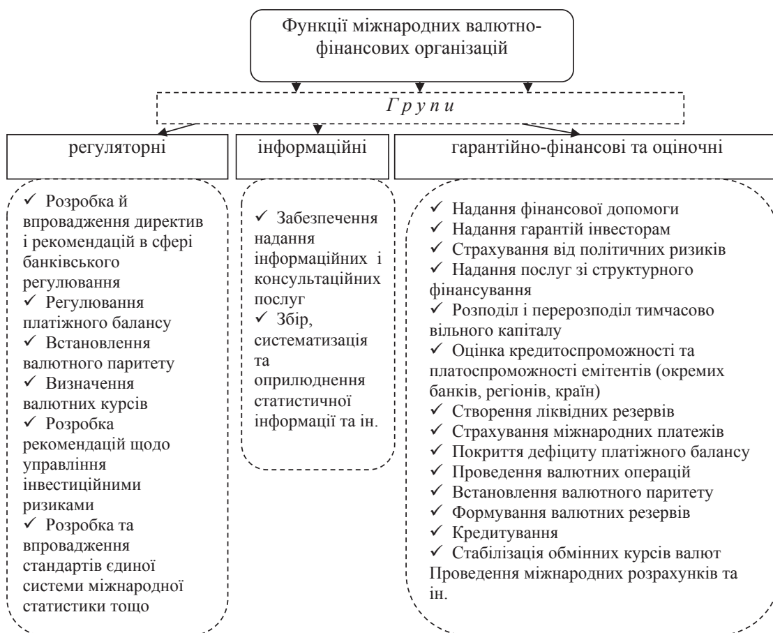
Рис. 1. Класифікація функцій міжнародних валютно-фінансових організацій

Ці групи функцій визначають напрями впливу міжнародних фінансових відносин на фінансову безпеку національних банківських систем і