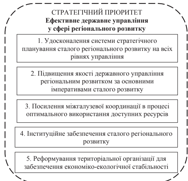
Рис. 2. Стратегічні напрями реалізації імперативів системи сталого розвитку у контексті досягнення стратегічного пріоритету Державної стратегії регіонального розвитку на період до 2020 року

Для успішної реалізації пріоритетних стратегічних цілей економічного зростання регіонів та країни важливим імперативом, який і виокремлюється у розробленій моделі регіонального кластера, є інституціональний. Так, наприклад, інституційне