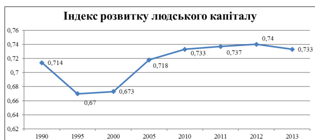
Рис. 1. Динаміка індексу розвитку людського капіталу в Україні за 1990-2013 рр.

1) зниження рейтингу індексу розвитку людського капіталу. В міжнародному рейтингу індексу розвитку людського капіталу, що розраховується щорічно для порівняння країн і визначення рівня життя, грамотності, освіченості та довголіття, у 2013 році Україна посіла 83 місце серед 187 країн, і була віднесена до країн із високим рівнем розвитку людського потенціалу (50 місце). Значення індексу розвитку людського потенціалу у 2013 році в Україні сягало 0,733. Варто зазначити, що порівняно із 2012 роком місце України у рейтингу не змінилося, проте порівняно з 2011 роком вона втратила сім позицій, стільки ж втратила у 2011 році порівняно із 2010 роком (тоді була 69 у рейтингу) [10].