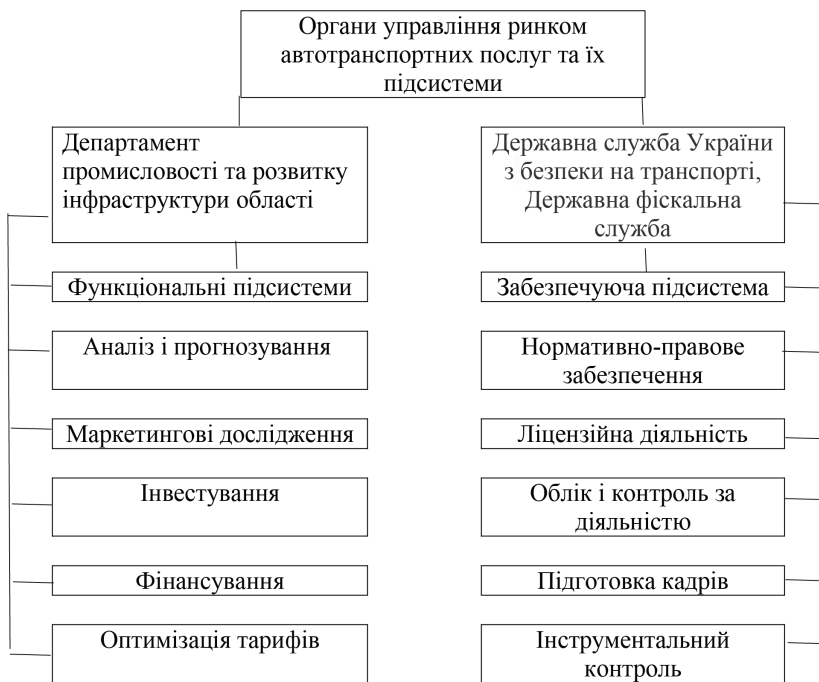
Рис. 3. Функції управління ринком автотранспортних послуг

Слід зауважити, що діяльність функціональних і організаційних підсистем безпосередньо залежить від діяльності фахівців департаменту транспорту і автомобільних доріг, Міністерства Інфраструктури, що поєднують свій професіоналізм з розумінням ролі функціонування автомобільного транспорту в нових ринкових умовах.