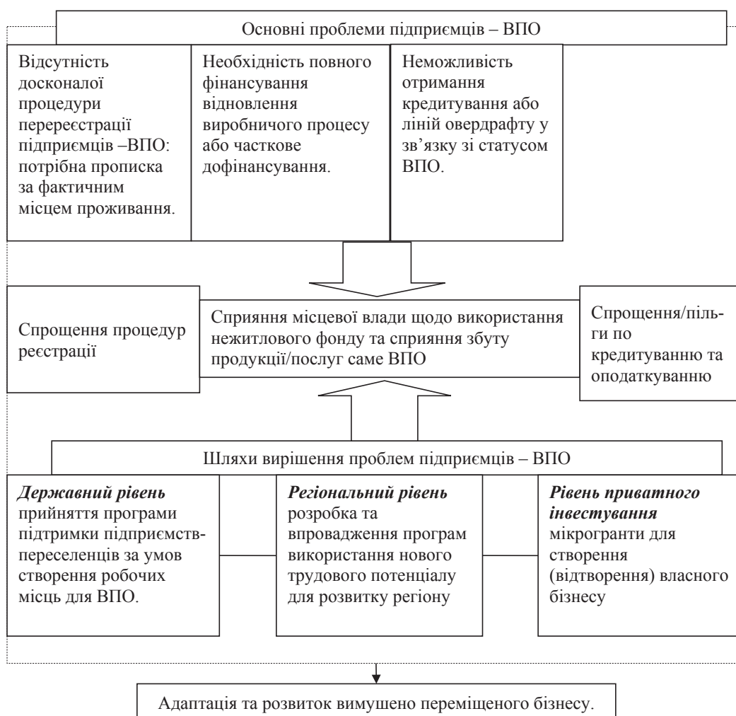
Рис. 1. Основні проблеми в адаптації та розвитку вимушено переміщеного бізнесу та шляхи їх вирішення

переселенцям, створеним ними формам малого