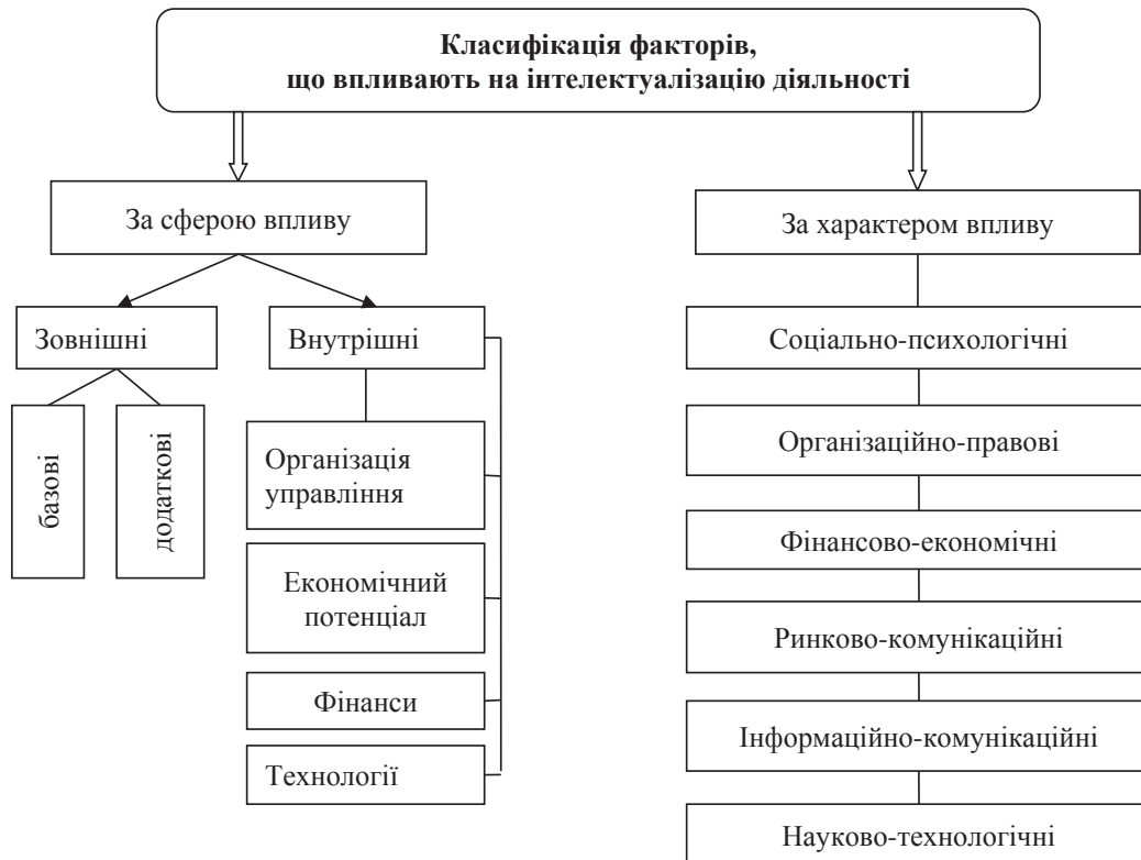
Рис. 1. Фактори, що впливають на інтелектуалізацію діяльності для забезпечення стабільного економічного розвитку підприємства