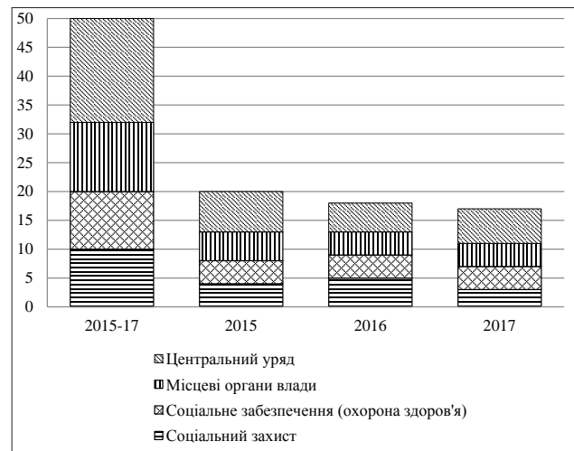
Рис. 2. План розподілу витрат у Франції на 2015–2017 рр., млрд. євро

У 2009 р. у зв'язку з кризою в європейських країнах спостерігався стрибок росту державних витрат як наслідок застосування дискреційних заходів зі стимулювання економіки, впливу автоматичних стабілізаторів, а в деяких випадках банківських вливань. Проте в 2014 р. країни повернулися до скорочення первинних витрат із метою фінансової консолідації [8]. У 2014 р. Франція оголосила план економії витрат, однак зберігши свій рівень державних витрат вище порівнюваних країн. Була запланована економія в розмірі 50 млрд. євро (рис. 2).