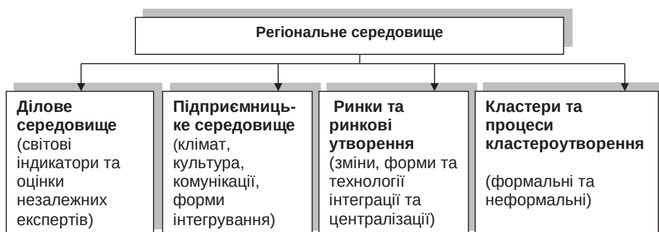
Рис. 2. Нові рівні аналізу та діагностування процесів розвитку регіонального середовища

Діагностика станів, складових розвитку регіонального середовища формує новітні можливості управлінського аналізу за рахунок вивченням стану і тенденцій досліджуваних об'єктів, а також оцінки змін, окреслення напрямів руху, визначення форм інтеграційних (дезінтеграційних) процесів з метою поліпшення регуляторного впливу, залучення цільового інструментарію менеджменту.