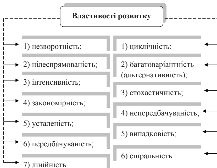
Рис. 1. Властивості розвитку

Окреме місце в економічному ракурсі дослідження категорії «розвиток» займає розвиток підприємства. Підвищений інтерес науковців до феномену розвитку підприємства породжує значку кількість підходів до трактування сутності цього поняття. Дослідження теоретичних засад проблематики розвитку підприємства на основі опрацювання значної кількості наукових публікацій дало змогу виявити значні розбіжності у визначенні природи цього поняття, його сутності та складових елементів.