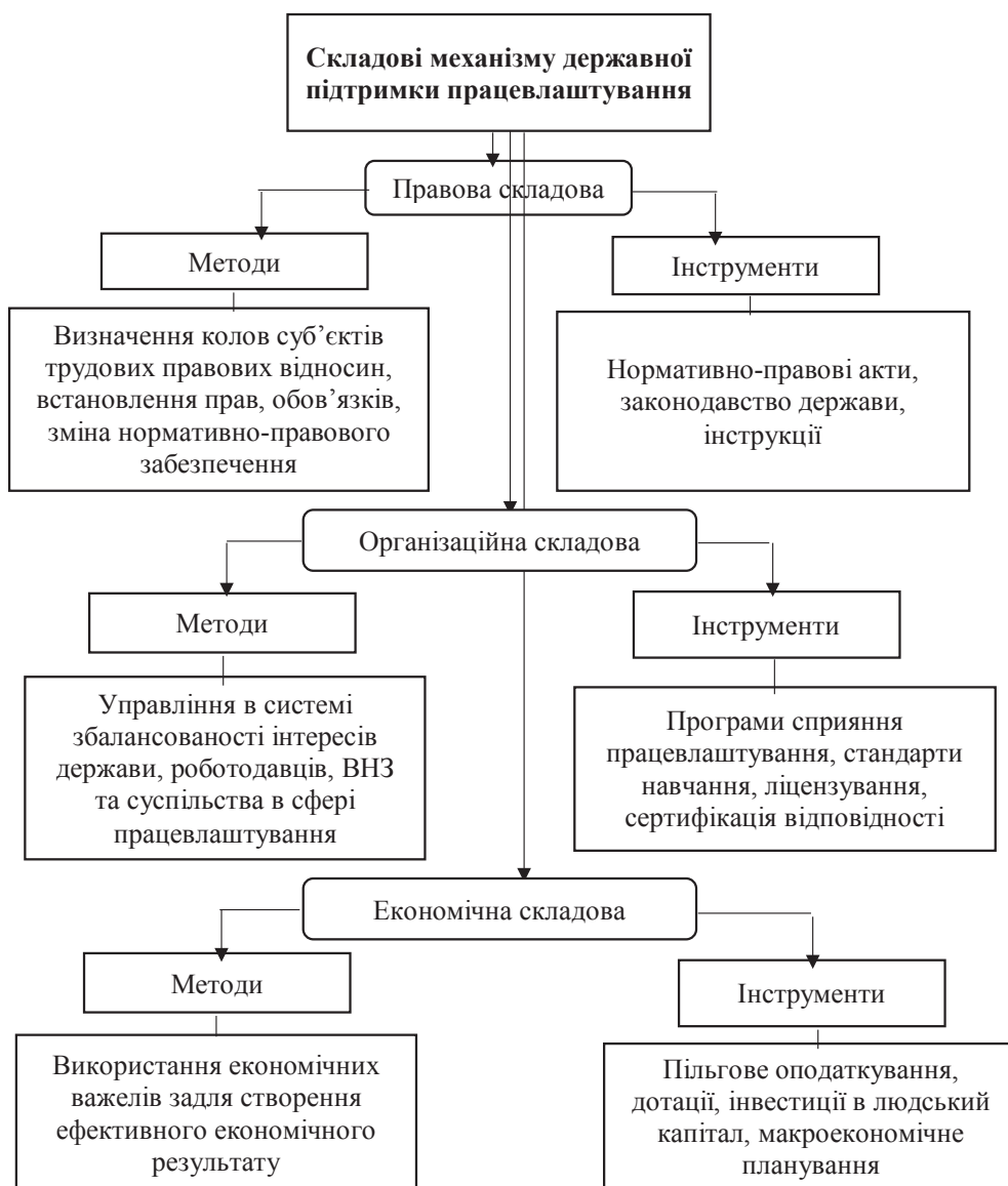
Рис. 1. Складові механізму працевлаштування населенню

Також в методах державного регулювання можна виділити чотири блоки, які дають змогу охопити набір його інструментів та засобів: нормативно-правові, які визначають правові рамки встановлення відповідності між попитом на робочу силу та її пропозицією, збільшення місткості ринку праці та зростання рівня зайнятості населення; соціально-економічні, тобто вплив окремих важелів політики оплати праці та доходів на обсяги пропозиції робочої сили та її структуру, формування механізму трудової мотивації.