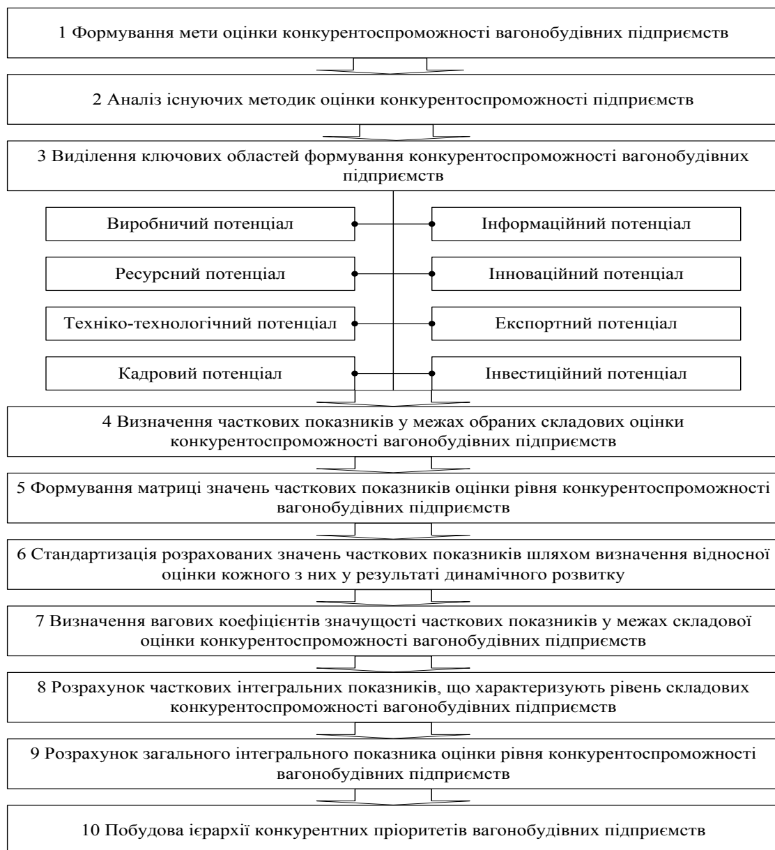
Рис. 1. Узагальнена послідовність етапів оцінки конкурентоспроможності вагонобудівних підприємств

- за конкурентоспроможністю персоналу: кваліфікація, досвід роботи, стаж, освіта, витрати на персонал.