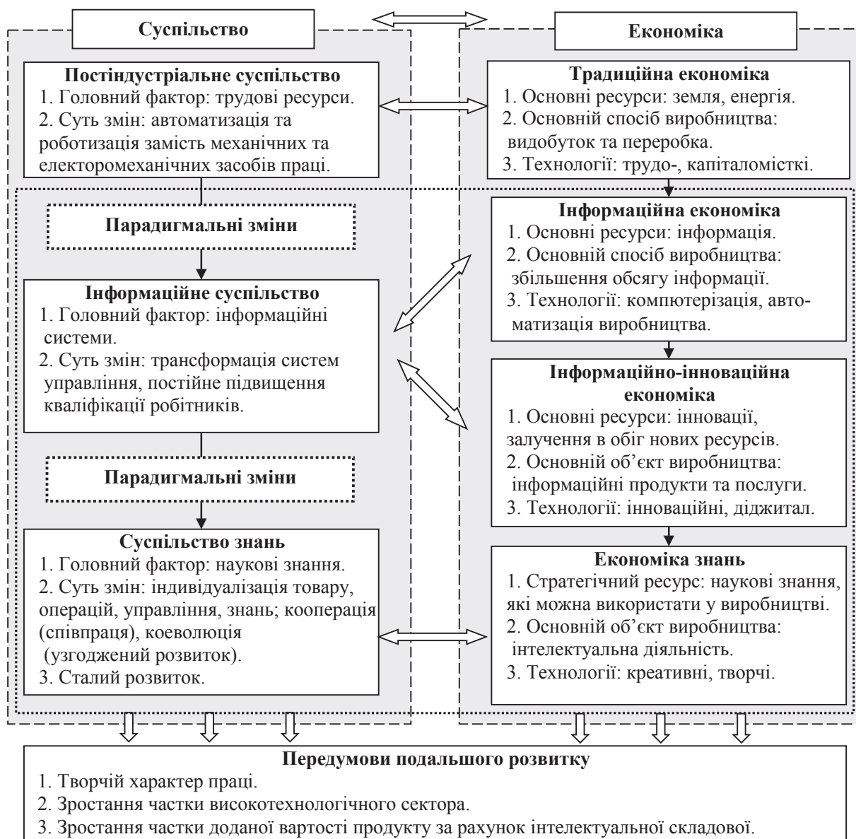
Рис. 1. Логіка розвитку суспільства та його економіки

– визнання інновацій та креативної діяльності людини пріоритетним джерелом розвитку;