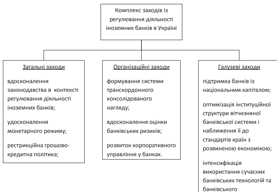
Рис. 3. Комплекс заходів із регулювання діяльності іноземних банків в Україні

Побудова ефективної системи регулювання іноземних банків є ключовим та необхідним завданням на шляху до мінімізації ризиків та негативного впливу діяльності іноземних банківських установ на банківський сектор України, а тому набуває важливого