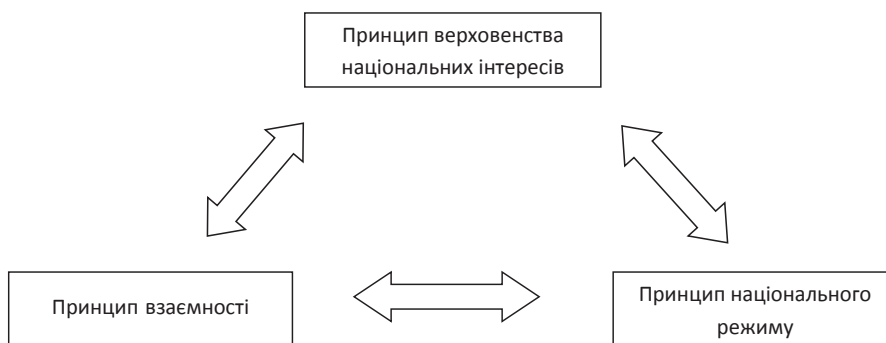
Рис. 1. Принципи регулювання діяльності іноземних банків

«умов взаємності» та характеризуватися активним застосуванням обмежувальних заходів по відношенню до іноземних інвесторів. У світовій практиці перелічені три принципи регулювання діяльності банків з іноземним капіталом є своєрідними «полюсами», які реалізуються у сполученні з перевагою одного з цих підходів.