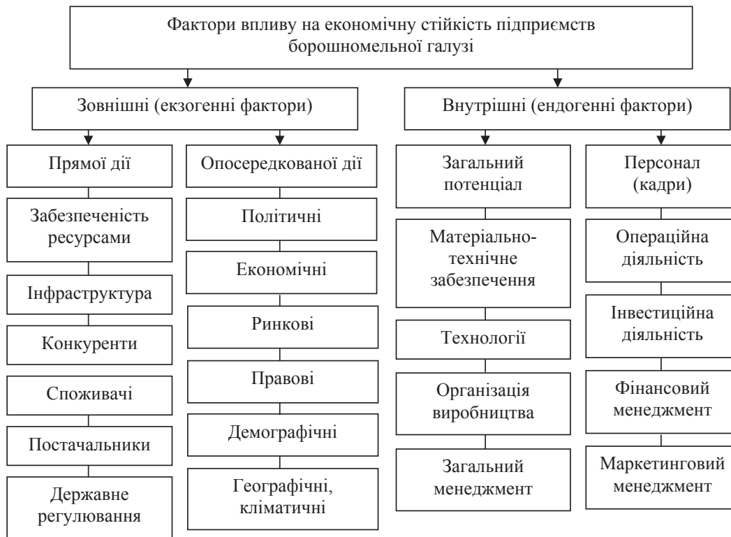
Рис. 2. Фактори впливу на економічну стійкість підприємств борошномельної галузі

нопольну політику, зниження рівня життя населення, особливо в останні роки і, навпаки, сповільнення темпів розвитку економіки і, практично, призупинення реформ і ринкових трансформацій у всіх галузях.