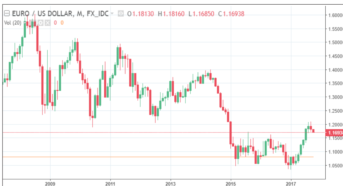
Рис. 2. Обмінний курс EUR/USD з липня 2007 року [3]

Обмінний курс у даному випадку відображає ефективність економіки. Падіння обмінного курсу євро до основної резервної валюти – долара США почалося з настанням глобальної фінансової кризи 2009 року, що й змінила зростаючий тренд (див. рис. 2). З того часу встановилася низхідна тенденція, що продовжується і на сьогоднішній день, попри періоди зростання обмінного курсу європейської валюти. Важливо відмітити, що криза