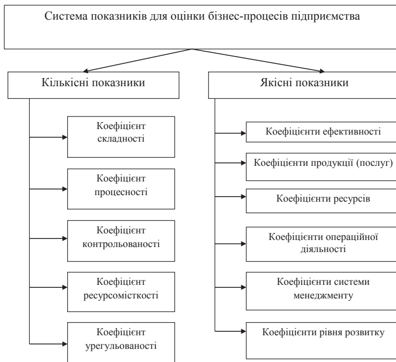
Рис. 3. Система показників, що характеризує ефективність бізнес-процесів підприємства