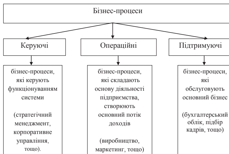
Рис. 2. Види бізнес-процесів

Коефіцієнт складності відображає відношення кількості рівнів декомпозиції моделі бізнес-процесів до кількості примірників процесів. Він показує, наскільки складна ієрархічна структура бізнес-процесів.