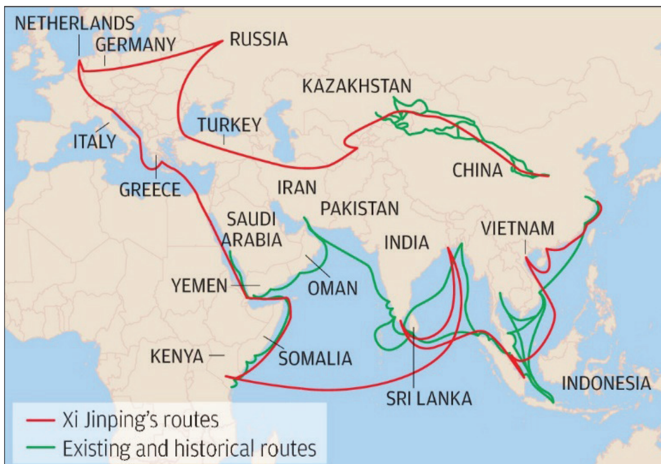
Рис. 2. Минуле і майбутнє. Зеленим виділені історичні та існуючі морські і сухопутні шляхи, червоним – заплановані [1 – scmp.com].

«Новий шовковий шлях» – це цивілізаційний проект. І це інноваційний проект, і цифровий, і "зелений", – сказав Сі Цзіньпін, зазначивши, що світ зміниться, коли проект буде реалізовано у 2030 році. Лідер країни підкреслив, що цей проект наближає мрію Китаю про гармонійний світ.