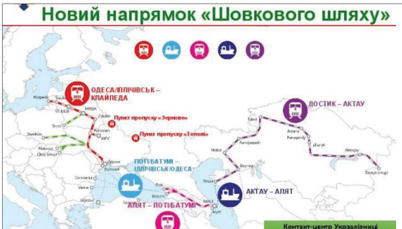
Рис. 3. Демонстраційний рейс контейнерного поїзда за маршрутом Україна-Грузія-Азербайджан-Казахстан-Китай

ваних двох днів провели п'ять. Невелика зупинка була і в Казахстані, але вже через людський фактор, оскільки цей рейс тестовий, і маршрут ще планувалося відпрацювати. Прес-служба Міністерства інфраструктури на таку невідповідність очікуваним термінам реальним відповіли, що тестовий рейс було відправлено спеціально для відпрацювання маршруту та налагодження спільної роботи операторів поїзда в кожній з країн-учасниць.